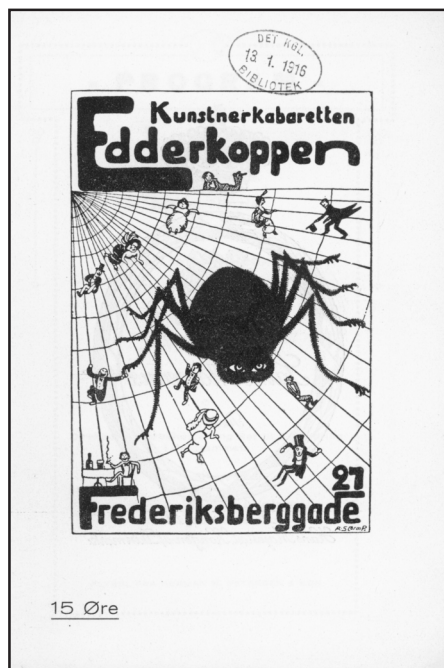
Robert Storm Petersens karakteristiske streg på Kunstnerkabaretten Edderkoppens program fra 1916.