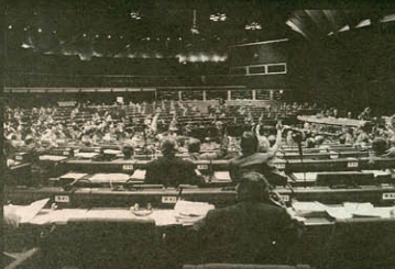
Europaparlamentet i Strasbourg. Amsterdamtraktaten betyder en yderligere udøvelse af demokratiet.

Hvordan ændrer Amsterdam Traktaten på dette? Ved at yderligere beslutningskompetence overføres til EU. Unionen startede med et økonomisk samarbejde, men er med Maastricht Traktaten blevet en Union, der dækker alle politiske felter - måske lige undtaget kirkepolitikken. Amsterdam Traktaten er en yderligere detaljering af denne politiske unions virkelfelter, og dermed en garanti for, at demokratiet rykker endnu længere bort.