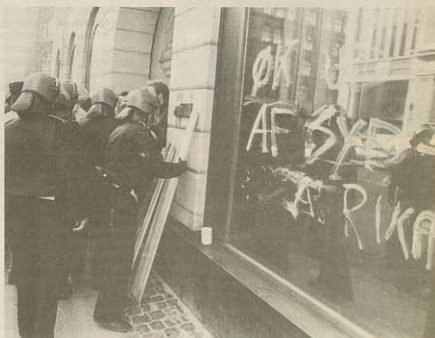
ØK ud af Sydafrika