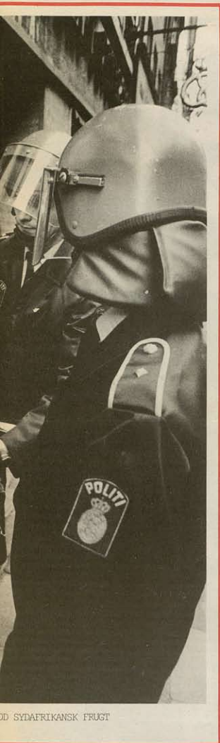
OD SYDAFRIKANSK FRUGT