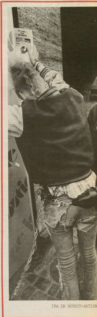
FRA EN BOYKOT-AKTION

F.eks. er Zimbabwe for 90% af sin handel afhængig af Sydafrika og er nok det land, som har været mest interesseret i at denne rute kom op på stå. Det har været et stort problem for trans-