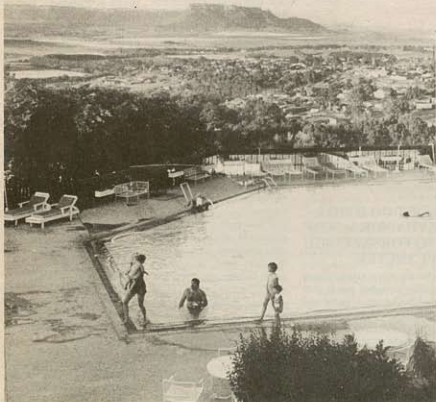
Et af de hvide sydafrikaneres feriecentre i Lesotho

BILLEDER FRA DANSKE SOLIDARITETSaktioner mod APARTHEID