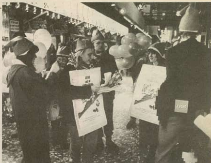
Solidaritet så det klodser