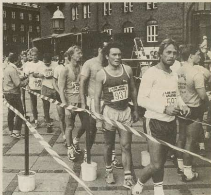
Giv en fod mod apartheid