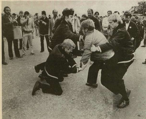
Alle politikneb gælder: 3 betjente er gået til angreb på en blokadevagt ved Provstenen.