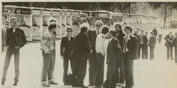
I færingerne med at lamme de centrale områder skal bruges op til overenskomsten. De dage, vi har været igennem i HT-konflikten, viser, at vi selv kan organisere en kamp.

Okay — de var indforståede med, at der blev lavet så