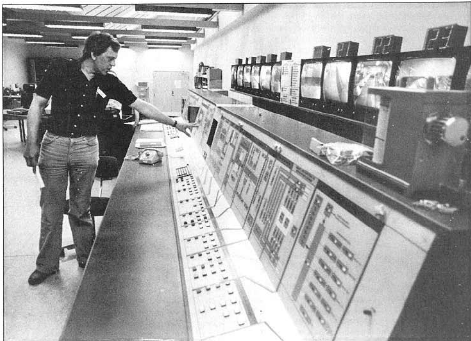
Den ny teknologi overflodiggør mange arbejdspladser. For arbejdsgiverne er det mere profitabelt at investere i nyt maskineri end i arbejdskraft. Er dette den ny bryggerarbejder? (Foto: 2. maj)

Risikoen for en verdensomspændende krig skyldes altså ikke kun krigsgale generaler og politikere. Den slags mennesker, der for enhver pris vil have magt o-