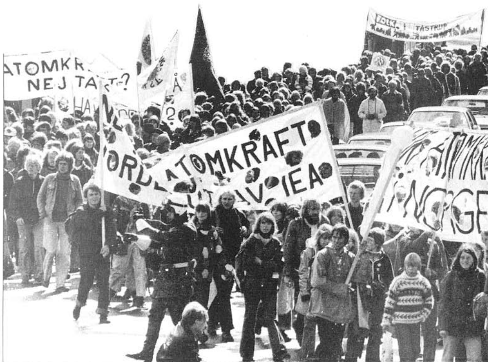
Kampen mod A-kraft er et vigtigt led i kampen for socialisme.

Begrænsningen i mellemlagene og bevægelsernes kamp ligger i, at kravene kun kan opfyldes, hvis de ikke anfægter kapitalistklassens fundamentale interesser. Over for dem kommer argumenter og protester uvægerligt til kort. Kan man ikke sætte magt bag sine krav, er chancen for at nå resultater ikke ret stor. Men en sådan magt har bevægelserne og mellemlagene ikke mange muligheder for at få på benene alene. Forudsætningen for andet og mere end nogle små sejre er derfor, at man allierer sig med arbejderklassen, som i mange tilfælde selv vil stå stærkere i sin kamp, hvis den kan udnytte mellemlagene viden og erfaringer.