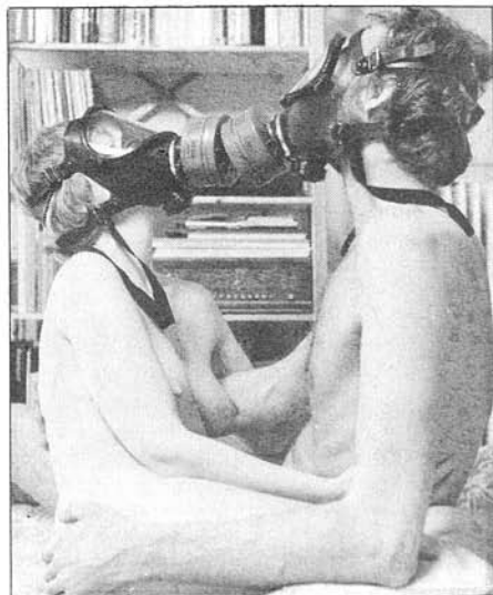
Øget brug af sundhedsfarlige stoffer kan give fosterskader. (Foto: 2. maj)

Hvis nogle arbejdere har taget tilløb til noget, der kunne udvikle sig til en trussel mod det kapitalistiske samfundssystem, så er der da også straks blevet taget hårdt fat. Her har de ledende socialdemokrater selv spillet en aktiv rolle for at få nedkæmpet den slags uromagere. Og når det ikke er nok, træder den borgerlige stats magtapparat i funktion med politiet, domstolene og evt. militæret, som sørger for, at arbejderne bliver sat på plads.