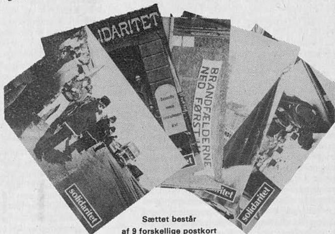
Sættet består af 9 forskellige postkort

Vi kan ikke tilbyde dig en flaske champagne for en ny abonnent på SOLIDARITET, men vi kan tilbyde dig et sæt postkort, som tak for din ulejlighed.