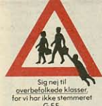
Sig nej til overbelastede klasser, for vi har ikke stemmeret! G.F.E.

Vil vi her dykke ned i skoleområdet, hvor besparelser og nedskæringerne vil øge socialt antal af kommende sociale tabere.