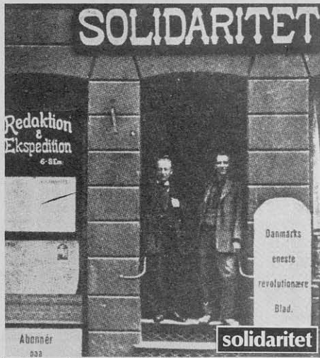
Syndikalisternes udgaver deres eget blad på 15.000.

dere, så har den senere socialdemokratiske historiskrivning i betydeligt omfang forlort og forvansket hele den side af historien.