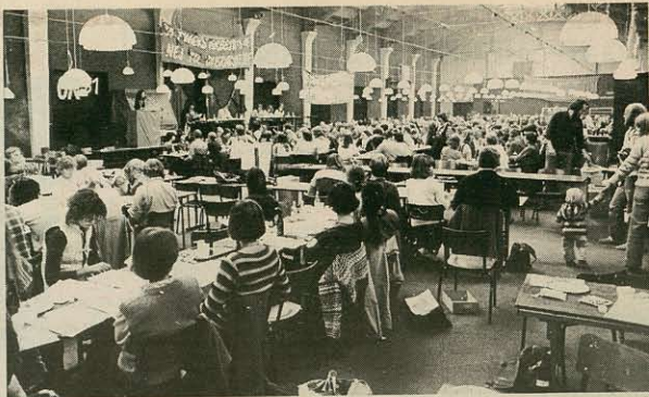
res til flere stillinger; voret ved indførelse af ny teknologio.

Koordineringen af overenskomstkampen skal ske omkring en række krav, som konferencen vedtog efter diskussion: Generelle lønforhøjelser: Størst stigning til de lavestlønede; 45 kr. i mindsteløn – fjern de nedreste løntin; fuld dyrtidsækning – ens kronbeløb til alle; fuld takrregulering, med tilbagevirkende kraft – ens dækning for alle; 35 timers arbejdsuge – 30 timer på skiftelohd med fuld lønkomensation, uden tempooprkning; nej til overarbejde – afspædning af alt livsnødvendigt overarbejde; aktionsret for alle offentligt ansatte; 8 ugers barselsloven og 26 ugers barselslov til kvinder, 13 uger til mænd – fuld lønkomensation; ferjeforlængelsen konverte-