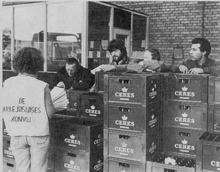
Konvojen samlede bl.a. ind til bryggeriarbejderne på Fredericia Bryggeri.

For at rejse disse krav med den nødvendige styrke, er det nødvendigt at de organiserede arbejdsløse selv går i spidsen. Arbejdsløse fra Kampagnegrupperne, fra Faglig Ungdoms Grup-