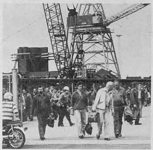
1973: 250.000 i kamp for 10 øre.