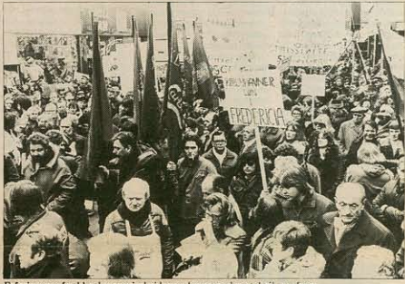
Erfaringerne fra bla. bryggeriarbejdernes kamp mod ny teknik må frem.

Hvordan kan den samlede arbejderklasse lære at koordinere de lokale kampe til en landsdækkende kamp, der afviser krisepolitikken og sikrer en god overenskomst. C.E.