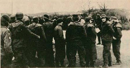
De værnepligtige menige på Hvorup kaserne siger nej til at transportere ammunition til amerikanske fly-depoter.

svag, nærmest symbolsk, blokadet i Esbjerg. Og havnearbejderne lostede bomberne efter at de havde fået et løntilleg, så vidt vi ved.