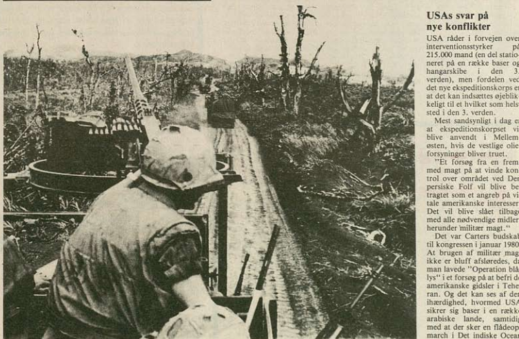
US-mariner på togt i Vietnam. USA skal igen spille rollen som verdens politi-betjent for at kunne fastholde landene i den 3. verden, specielt Mellemøsten, under imperialismens åg.

Det var Carters budskab til kongressen i januar 1980. At brugen af militær magt ikke er blott afsløret, da man lavede "Operation Blyss" i et forsøg på at befri de amerikanske gidsler i Teheran. Og det kan ses af den ihærdighed, hvormed USA sikrer sig baser i en række arabiske lande, samtidig med at der sker en flådemarch i Det indiske Ocean og Den persiske Golf.