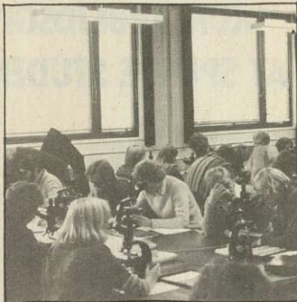
De 20 mill.kr., der skal spares på Københavns Universitet i næste finansår betyder at lærere fyres, at der bliver mere trangsel på studiesalene og undervisningen dårligere.

Opfordring fra redaktionen om, at man rundt omkring på de forskellige uddannelsessteder hurtigst muligt får startet diskussioner og nedsat grupper i tilknytning til elev/studenterrådene, som studerer forholdene dér, hvor man er.