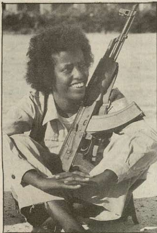
Den nye aggressive supermagt Sovjet vinder frem, men også Sovjet møder modstand. F.eks. i Eritrea, hvor folket fører en heltmodig befrielseskamp. De fortjener al mulig støtte også fra de danske uddannelsessøgende.

I Eritrea kæmper folket for at befri deres land fra Etiopien og danne en selvstændig stat. Kun i kraft af den militære støtte, det vaklende etiopiske regime har fået fra Cuba og Sovjet, har det været muligt