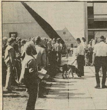
3 kollegianere på Skjoldhøj er blev smidt ud. Det er det alvorligste skridt staten har taget for at stoppe huslejeboycotterne. De uddannelsessøgende må gå ind i de lejeværn, som kollegianerne har oprettet for at forsvare sig mod udsmidningerne.

Kollegiekampen må støttes fra uddannelsesstederne. Folk må melde sig til lejeværene, som der vil blive brug for fremover. Og den aktionsfond, som Kollegierne Landsboycotudvalg har oprettet, må støttes for at sikre, at ingen kollegianere rammes økonomisk af bøder og fogedsager.