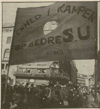
En central opgave i SU-kampen det kommende år bliver at modvirke den splittelse, der ligger i CUR's SU-reform.

Men resultaterne har været nedslående. I de organisationer, der skal være de uddannelsessøgendes redskaber i kampen, har de ledende fraktioner bremset udviklingen af en mobilisering henimod en kamp. I DUS-organisationerne, hvor DKP er dominerende, har toppens politik været, at de uddannelsessøgende ikke skal kæmpe en egentlig kamp, men istedet nøjes med at appellere til politikkerne og offentligheden. I DSF, hvor VS har stor indflydelse, har en del af det regerende flertal hidtil været modstandere af, at studenterne kæmper en delkamp alene for økonomiske interesser — de vil have hele uddannelsespolitikken med i en kamp. Og selvom dele af VS ligesom KAP har ment, at SU-kampen må rettes mod Socialdemokratiet og dets krisepolitik, har de på forhånd taget kampen for umulig. Men