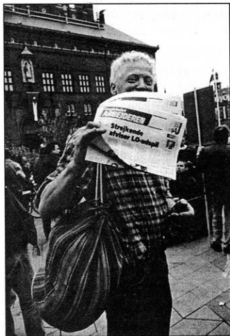
Dagbladet Arbejderen er ubetinget et af DKP/ML's vigtigste aktiver.

Også andre større opgaver presser sig på. Således har det været centralkomiteens ønske at påbegynde udarbejdelse af en ajourført klasseanalyse, men det har desværre endnu ikke været muligt på grund af mangel på kræfter.