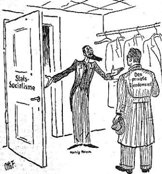
HARTVIG FRISCH: Velkommen! — Vil De ikke at med Overfrakten?

Man kan lide Socialdemokratiet, at det gør noget for at søge at overbevise Valgerne om, at den fordrejede Socialisering vil gavne Danmark. Bladet „Social-Demokrater“ opger med Støthed, at det sender 5,820.000 Tryksager ud over Landet. Ca. 6 Miljoner „Sandhedsaktive“.