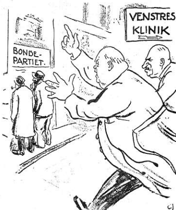
DE GAMLE HERRER: Hallo, De dér! De gaar den gale Vej!

12) Venstre stemte ved Lockoutlovens Behandling imod Bondepartiets Forslag om en Forhøjelse af Støttingens